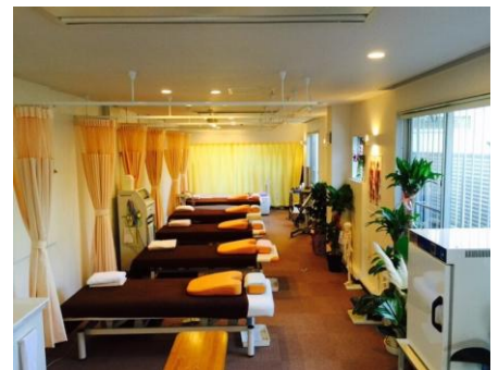
1階 M-スマイル整骨院