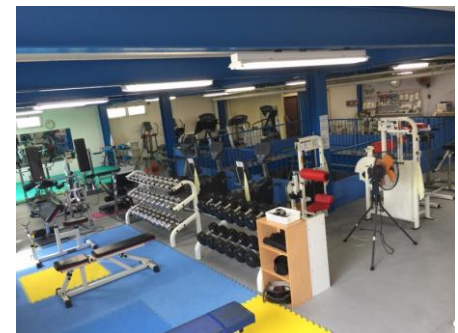
2階 スポーツジムフェニックス